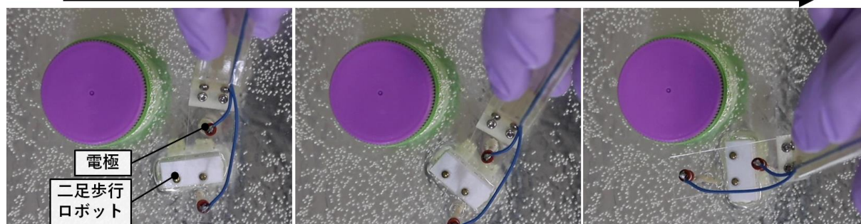
図1：二足歩行ロボットによる旋回運動。「二足歩行ロボット」部分が約90度右旋回している。