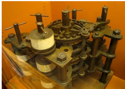
Figure 2. Parts of the original Babbage's machine.