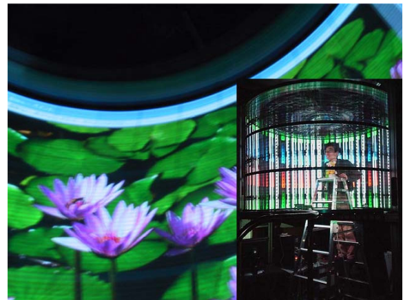
図 2 : TWISTER IV

本 SG では一昨年度試作した TWISTER III の改良版である TWISTER IV や光線再生型立体ディスプレイ SeeLinder およびこれらの装置で全周実写画像を提示するために必要な全周型立体カメラを試作した。これらは最終目標である空間型相互トレイグジスタンスルーム実現のための視覚情報ディスプレイ装置であり、実世界と情報世界の融合技術の研究の基盤となる装置の開発に成功した。(図 2)