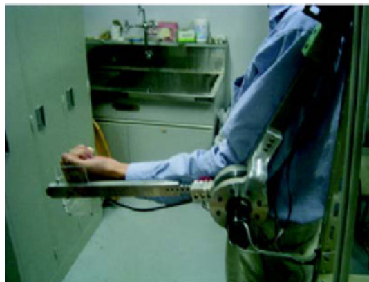
図4. 試作したアシストデバイス装置

い、また、ラット運動野の神経情報により車両を操縦するラットカーシステムの開発を行った。