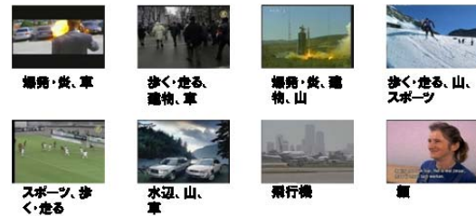
意味ラベル付与結果

数万枚の画像や数百時間の映像から概念を学習し、未知の画像・映像に自動的に意味ラベルを付与する技術について検討しています。識別に有効な画像特徴量や効果的な機械学習技術の検討から、大規模な画像・映像に対する巨大な語彙数の概念の効率の良い学習・識別手法、さらには視覚的概念とは何かという検討まで、幅広い研究を行っています。