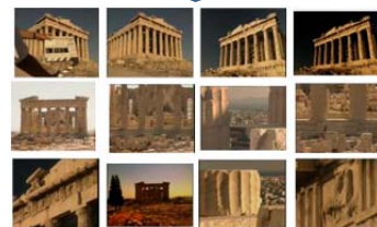
映像アーカイブ中の特定物体の検索