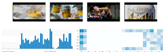
コマーシャル映像の高速検出・同定と放送パターンの解析